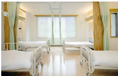
↑ 新館病室 ↓ 新館5階いちょうの湯