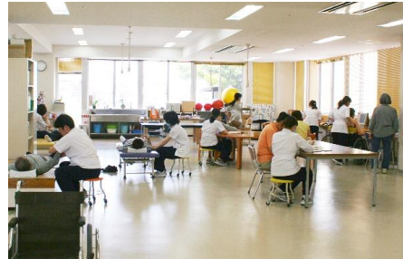
理学療法室(上)・作業療法室(下)