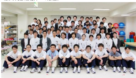
約100名のリハビリスタッフ