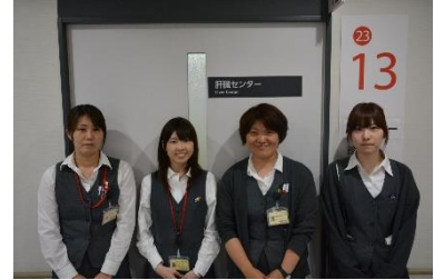
肝臓センター事務職員