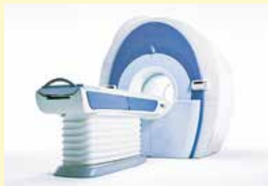
オプション検査の充実

広島赤十字・原爆病院に併設しており急性期総合病院の検査レベル、診断レベルでより質の高い健診を提供しています。さらに、精密検査・治療においても迅速な連携が図れるようサポートしています。