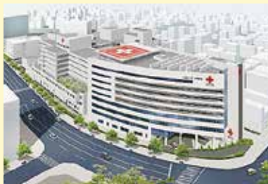
急性期総合病院に併設

広島赤十字・原爆病院に併設しており急性期総合病院の検査レベル、診断レベルでより質の高い健診を提供しています。さらに、精密検査・治療においても迅速な連携が図れるようサポートしています。