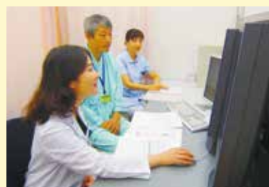
充実のアフターフォロー

画像検査は認定医や専門医のダブルチェックを行っています。豊富な健診データやその後の結果を分析し、より精度の向上に努めています。