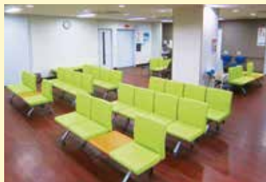
健診施設の区別化

少しでも詳しく調べたいという方に豊富なオプションをご用意しています。年齢や病歴などに合わせ、より最適なオプション項目を選択していただけます。