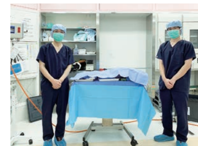
腹腔鏡検査を行う手術室にて

肝疾患の治療は日々進歩しています。当科では患者さんの目線に立った最先端の医療の提供をめざして、しっかりとしたインフォームド・コンセントのもと個別に最適な治療を行うように心がけています。新薬の治験なども患者さんのご希望があれば積極的に取り入れ、医療の質の向上を図っています。肝臓だけではなく全身管理も他科と密に連携しながら診療を行い、来院ごとに栄養状態を把握し、必要な場合は管理栄養士による栄養指導を行っています。かかりつけ患者さんの急変時には迅速に対応します。